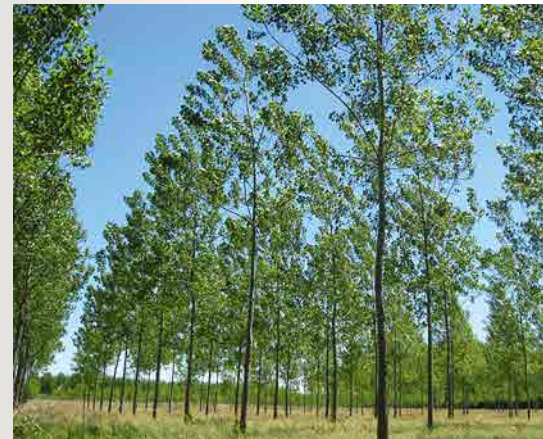
Soligo de 6 ans.