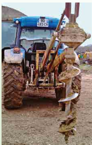
Tarière 40 cm.