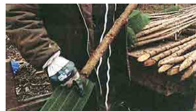
Mise en place d'une protection contre le gibier.