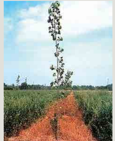
Désherbage chimique localisé.

Obligation de faire appel aux entreprises certifiées CERTIPHYTO pour l'utilisation de produits phytosanitaires homologués ou avoir obtenu le certificat « certiphyto ».