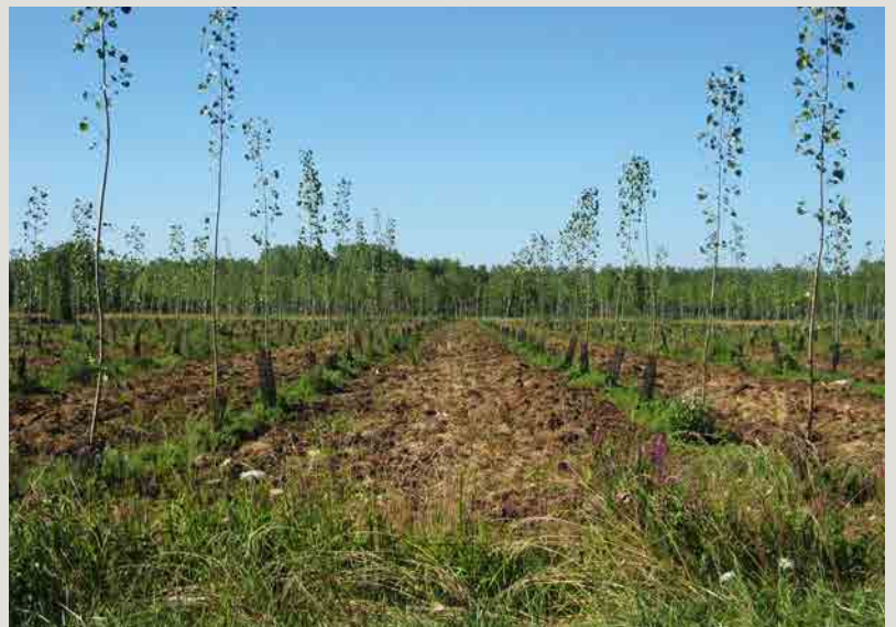
Passage simple de cover-crop.