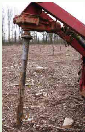
Plantation à la fraise à potet.