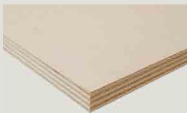
Contreplaqué en peuplier.

Le bois d'industrie de peuplier est également apprécié par les pape-tiers, les fabricants de panneaux particules, mais aussi les utilisateurs de bois énergie.