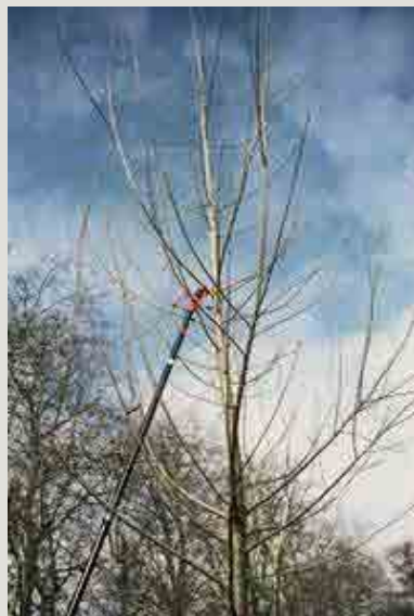
Taille de formation.

Le populteur coupe les branches basses de l'arbre sans laisser de chicots jusqu'à obtenir une grume de 6 à 7 m de longueur, propre, sans nœud. Il vise à produire du bois de qualité haut de gamme pour les utilisations les plus rémunératrices. Cette