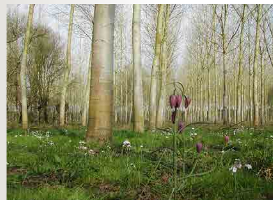
Fritillaire pintade sous peupleraie.