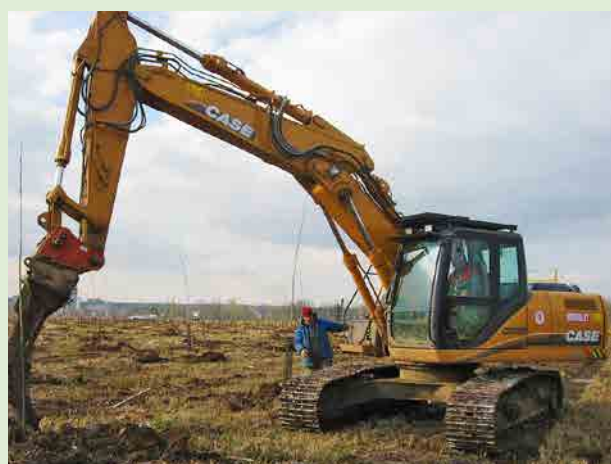
Plantation à la pelle avec une dent.