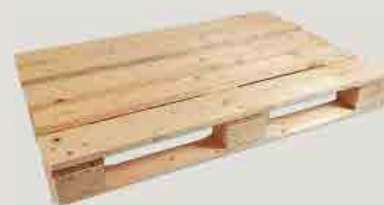
Palette en peuplier.

De nouveaux débouchés ont vu le jour notamment dans les constructions modernes en bois, sous forme de poutres lamellées-collées. En bardage également, un nouveau process est disponible sans ajout de produit chimique (Bois Modifié Thermiquement) pour une utilisation en extérieur. Pour ces nouveaux usages, la qualité (bois élagué, droit, etc.) est également demandée pour assurer un débouché rémunérateur.