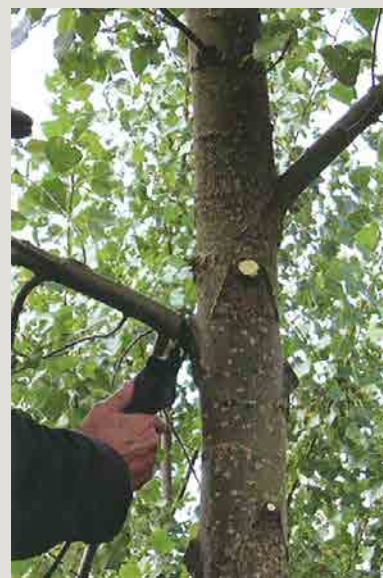
Elagage avec un sécateur électrique.

Taille de formation et élagage sont indispensables à la production d'un bois de qualité. Un élagage brutal conduit inévitablement à l'apparition de gourmands qu'il faudra enlever par la suite.