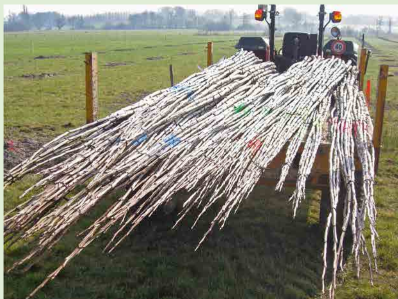
Plançons de peupliers 1 an.

Sur la même durée, l' impôt forfaitaire sur le revenu forestier est également réduit . Il est possible de bénéficier aussi d'allègements fiscaux (« DEFI travaux » : déduction des dépenses des revenus imposables). D'autres aides existent ou sont à l'étude (Charte Merci le peuplier, appel à projets du Conseil Régional de Bourgogne...). N'hésitez pas à contacter le technicien du CRPF.