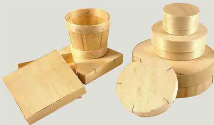
Boîtes à fromage en peuplier.

De nouveaux débouchés ont vu le jour notamment dans les constructions modernes en bois, sous forme de poutres lamellées-collées. En bardage également, un nouveau process est disponible sans ajout de produit chimique (Bois Modifié Thermiquement) pour une utilisation en extérieur. Pour ces nouveaux usages, la qualité (bois élagué, droit, etc.) est également demandée pour assurer un débouché rémunérateur.