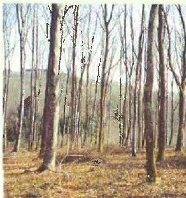
LES ÉCLAIRCIES SE SUCCÈDENT...

➤ Le sous-étage et les arbres dominés sont conservés pour favoriser le gainage et la stabilité du peuplement.