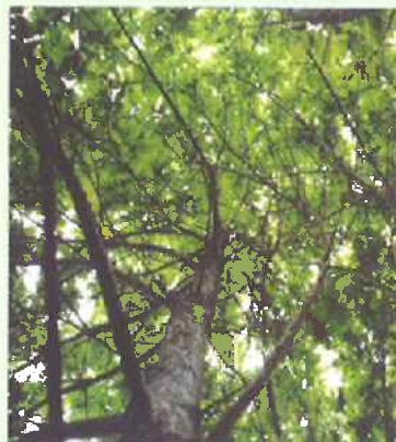
HOUPPIER D'UN ARBRE DÉSIGNÉ AVANT LE DÉTOURAGE...