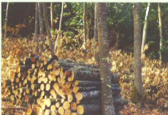
EXPLOITATION DU PEUPEMENT