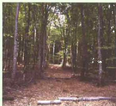
OUVERTURE DES CLOISONNEMENTS