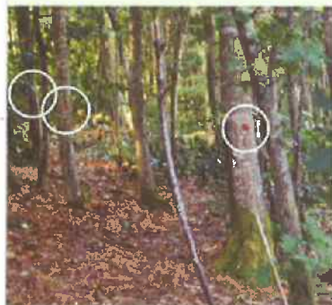
BALIVAGE D'UN TAILLIS DE CHÊNE ROUGE