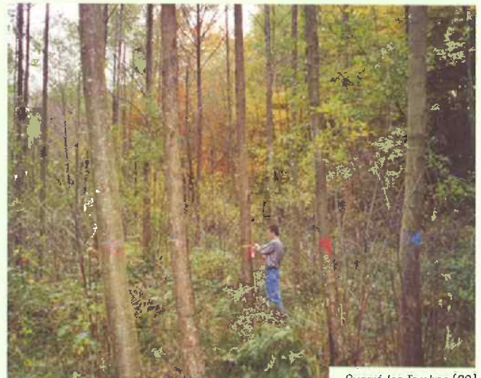
DÉSIGNATION DANS UN TAILLIS D'AULNE