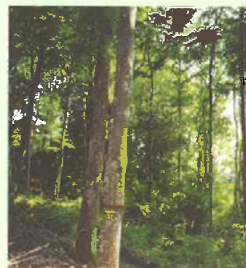
...JUSQU'À CE QUE LES ARBRES DÉSIGNÉS ARRIVENT À MATURITÉ.

➤ 5 à 15 ans après la première intervention en fonction de la vigueur du peuplement, 5 ans dans les jeunes peuplements, tous les 10 à 15 ans ensuite, prélèvement de 25 à 30 % du peuplement, toujours au profit des arbres-objectif en favorisant le développement de leur houppier jusqu'à l'exploitation finale.