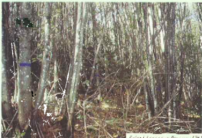
DÉSIGNATION DANS UN TAILLIS DE CHÂTAIGNIER

Le détournage est applicable à toutes les essences, il est recommandé pour les essences susceptibles de produire des gourmands (chêne et châtaignier) et pour les taillis âgés.