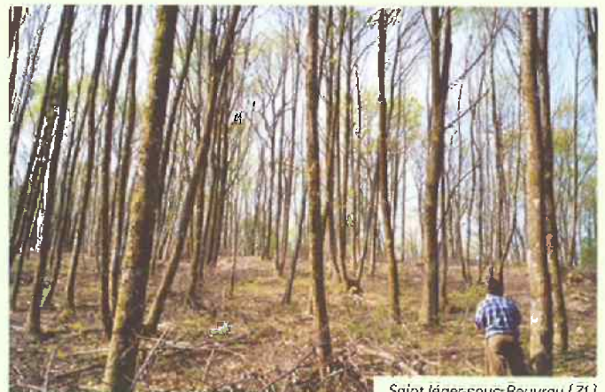
FUTAIE DE CHÂTAIGNIER ISSUE D'UN BALIVAGE INTENSIF