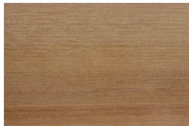
Bois de bouleau