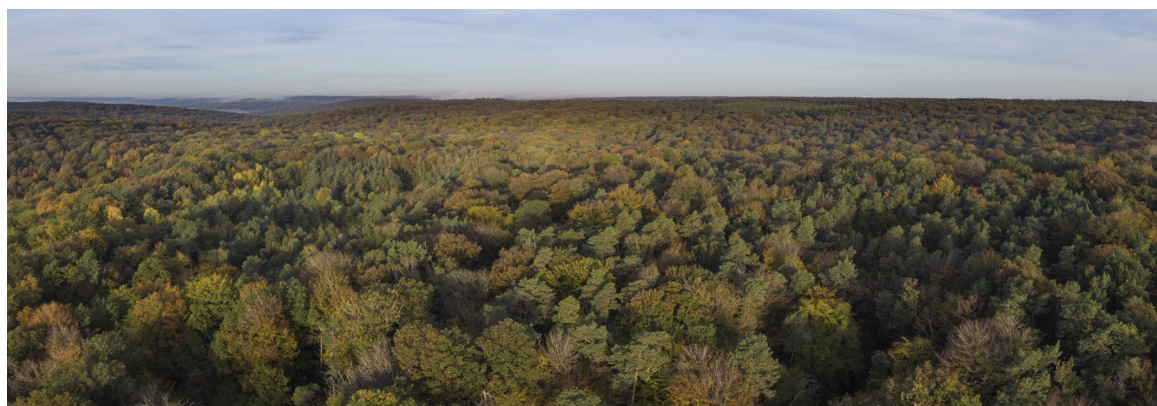
Sylvain Gaudin © CNPF

Après une période de 5 ans, au cours de laquelle peut avoir lieu une visite de mi-parcours réalisée par C+FOR, un audit documentaire et de terrain est réalisé afin de s'assurer de la bonne mise en œuvre du projet, et plus particulièrement que les exigences des méthodes ont bien été respectées.