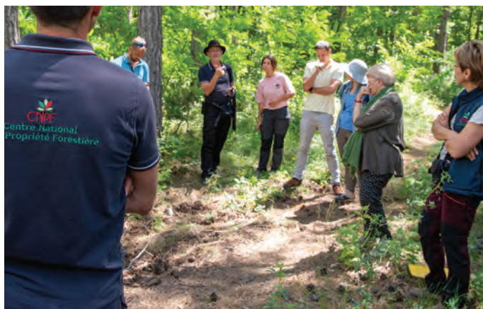
Olivier Martineau © CNPF

** Nécessite une adhésion au CETEF Formation de Franche-Comté (60 € en 2024). Dans la limite des places disponibles (25 stagiaires max.). Logement, déplacements et repas à votre charge.