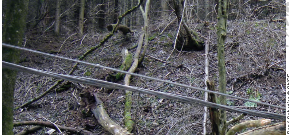
René Sabatier © CNPF

Notre syndicat, n'est pas une compagnie d'assurance palliant les carences de gestion forestière. Tous les bois risquant de causer des dommages à un tiers, doivent être exploités au plus vite : arbres en bordure de routes, lignes ENEDIS, RTE, Fibre, canaux, voies ferrées, sentiers de randonnée, etc. Il en va de la pérennité de nos contrats responsabilité civile (RC). Un propriétaire doit se rendre dans sa forêt au moins une fois par an, veiller sur l'état de ses bois de bordure, notamment les bois dépérissants ou secs . Si ce n'est pas possible, un contrat avec un gestionnaire forestier est indispensable. Nous pouvons vous transmettre la liste de ces professionnels.