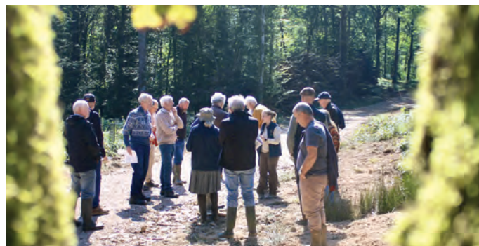
Chloé Monget © Terres de Bourgogne

Le stage a rapidement affiché complet avec 25 participants. En 2025, un cycle de base est proposé : 9 journées réparties sur l'année, dans les quatre départements bourguignons, pour aborder l'ensemble des aspects techniques et administratifs de la gestion forestière. N'hésitez pas à contacter le FOGEFOR de Bourgogne pour vous inscrire !