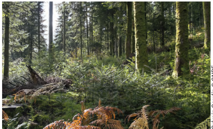
Sylvain Gaudin © CNPF