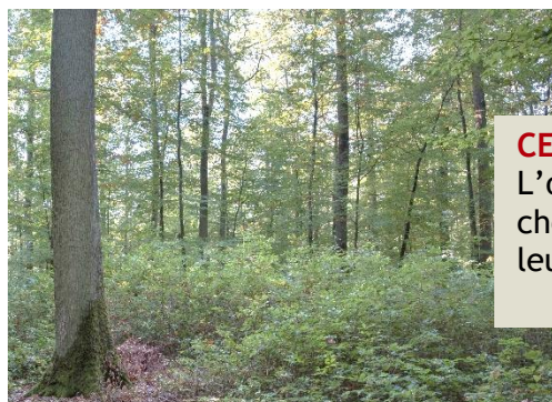
Sylvain Gaudin © CNPF

CETEF Chênes : Le chêne est l'essence reine des forêts françaises. L'objectif de ce groupe est de s'intéresser aux différentes espèces de chênes, leurs sylvicultures, leur marché, leurs transformations, et leur adaptation au changement climatique.