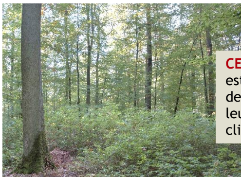
Sylvain Gaudin © CNPF

CETEF Chênes : Groupe de travail en cours de formation - Le chêne est l'essence reine des forêts françaises. L'objectif de ce groupe sera de s'intéresser aux différentes espèces de chênes, leurs sylvicultures, leur marché, leur transformation, et leur adaptation au changement climatique.